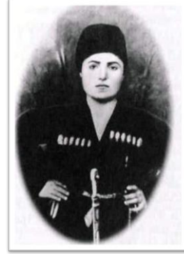
Mücahid Makbule Hanım 1902 - 1922

Öyle ümit ederim ki şu kadının namı hatıra-i millette unutulmaz...”