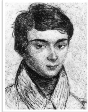
Evariste Galois 1811 - 1832