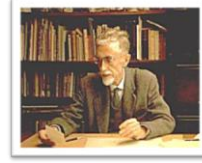
M. C. Escher 1898 - 1972