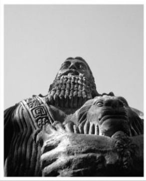
Uruk Kralı Gilgamiş